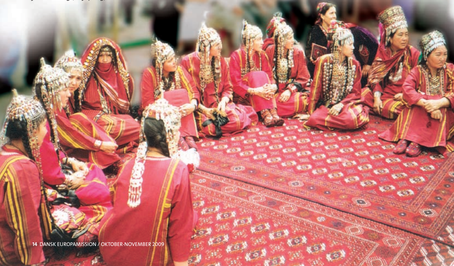
Turkmenske kvinder i traditionel festklædning (Dayspring).

Distributionsprocessen tilpasses løbende efter, hvad der ud fra sikkerhedsmæssige overvejelser er hensigtsmæssigt. I distributionsprocessen spørger vi altid de lokale troende, hvordan de ønsker, vi skal distribuere bibedelene. Vi ønsker nemlig ikke at foretage os noget, der kan påføre dem yderligere forfølgelse midt i de meget hårde forfølgelser, de i forvejen gennemgår.