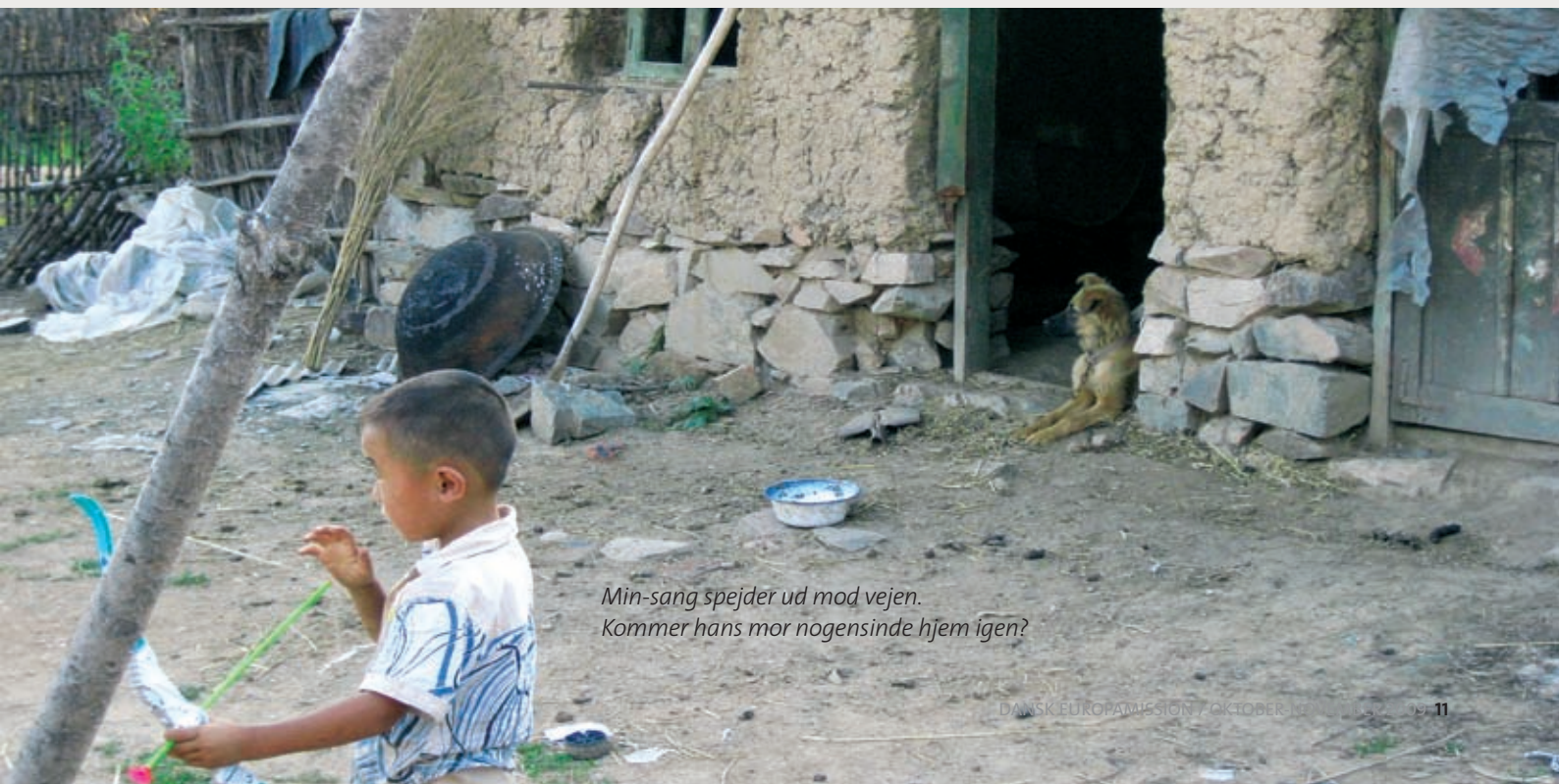
Min-sang spejder ud mod vejen. Kommer hans mor nogensinde hjem igen?