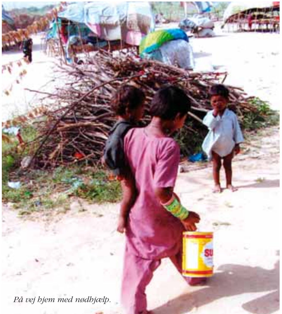
På vej hjem med nødhjælp.