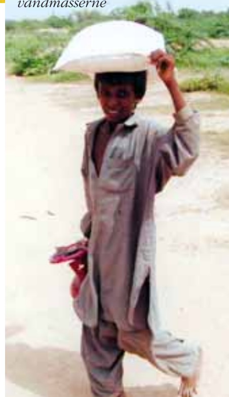
Ris til en fattig familie ramt af vandmasserne

Fra Dansk Missionsråds Udviklingsafdeling fik vi en bevilling på 250.000 kr. fra DANIDAS nødhjælpsmidler, og vi har fra Dansk Europamission kunnet lægge godt 142.000 kr. oveni, som kommer direkte fra vore givere. Vi er meget taknemmelige for, at vore givere har sluttet op om at hjælpe vore partnere i Pakistan med at sørge for nødhjælp til de mange, som ingen andre nåede ud til i de fattige samfund uden for storbyen Karachi.