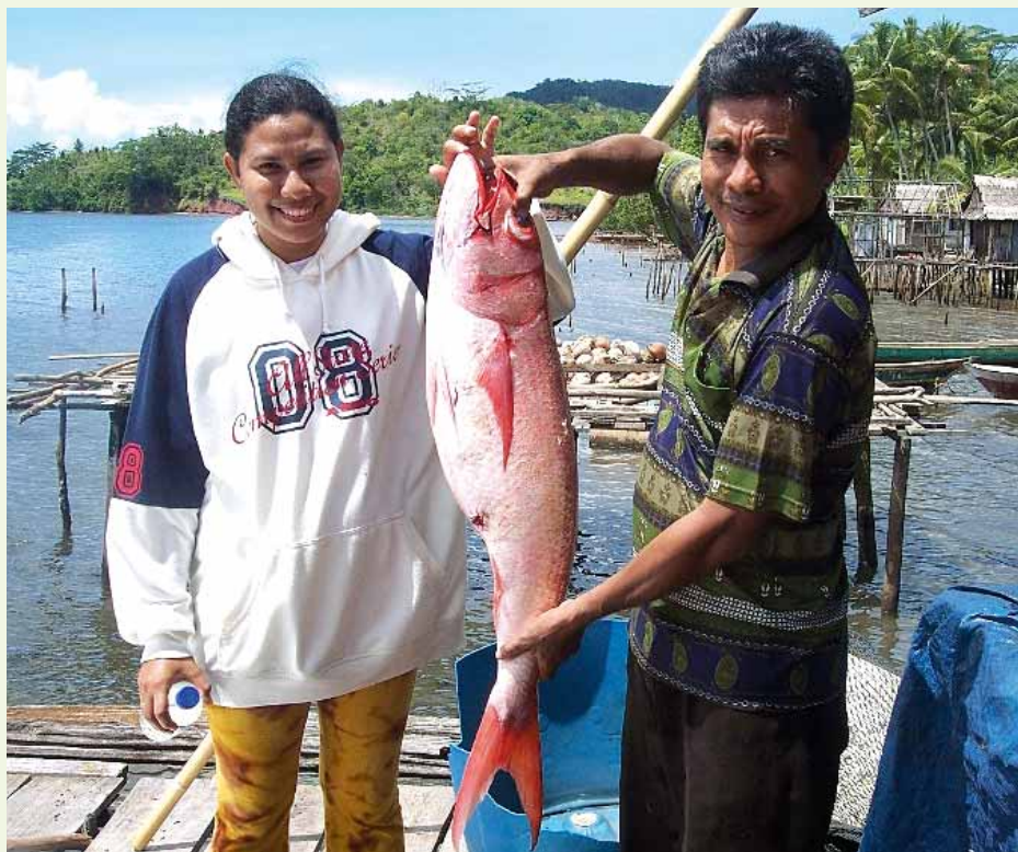
Kristne fiskere fra Lata-lata har fået sig en god fangst.

Siden 2003 har vi købt jord, bearbejdet jorden og forberedt samfundet på at flytte ud af flygtningelejre til deres nye hjemstavn i Det nordlige Sulawesi. Vi blev konfronteret med mange problemer i form af bureaukrati og naturkatastrofer (oversvømmelser), før vi blev i stand til at påbegynde byggeriet. Vi kan nu fortælle jer, at 14 huse er blevet bygget, og at husbyggeriet vil fortsætte i takt med, at midlerne er til stede, indtil hele dette samfund er blevet genetableret. Vi afgav et løfte til dem, da vi reddede dem, at vi ikke ville forlade dem, før de var i deres egne hjem. De har nu fiskerbåde, så de kan hjælpe med til at forsørge samfundet. De er ved at så afgrøder. Snart vil vi bygge den kirkebygning, som også vil blive en del af et missionsstræningscenter, og andre kapacitetsopbyggende og mikroøkonomiske udviklingsprojekter er på