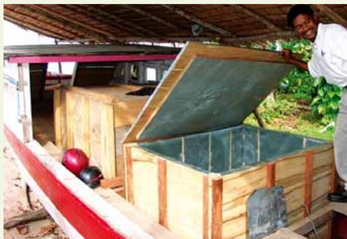
En fiskerbåd giver mad på bordet til mange mennesker.