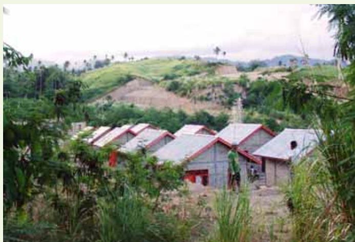
De nyopbyggede huse til fordrevne kristne.

sat at bede om, at Kirken har styrken, salvelsen, kærligheden, medfølelsen, frimodigheden, visdommen og troen til at fortsætte færdiggørelsen af den opgave, som Han har givet os, indtil Indonesien er fuld af Herrens herlighed.