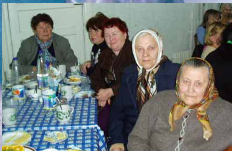
Enkesamling i Alchevsk i Ukraine.

1.000 kulminer, og det er her i dette område, jeg har haft mange møder