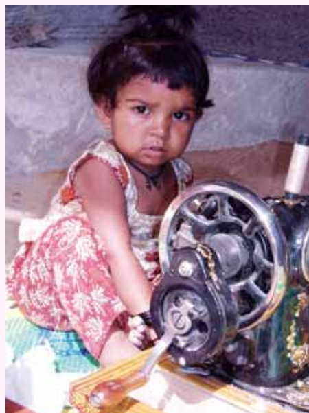
Denne lille pige vil gerne gøre storesøster kunsten efter.

Derfor opfordrer vi til fortsat støtte af sycentrene, som vi måske skal kalde husflidscentre i fremtiden. Vi har snart rundet de 1.000, men der er langt flere unge piger i samme situation, udsat for overgreb og dyb nedværdigelse. Kurserne har ikke alene betydning for de unge piger, der bliver reddet fra en sådan dybt nedværdigende situation, muligvis med selvmord som resultat. Redningen består ikke bare i en forbedret økonomi, men i opbygning af deres selvværd, og, som det største: De lærer Jesus at kende, og de bliver i stand til at dele evangeliet med andre. Sykurserne har med andre ord evighedsbetydning.