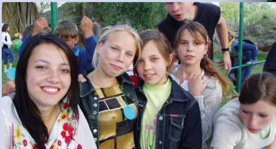
Teenagere fra børnehjemmet i Izmail i Ukraine.

En af de mange enker fra mineulykker, som Poul har hjulpet med mad og budskabet om Guds kærlighed.