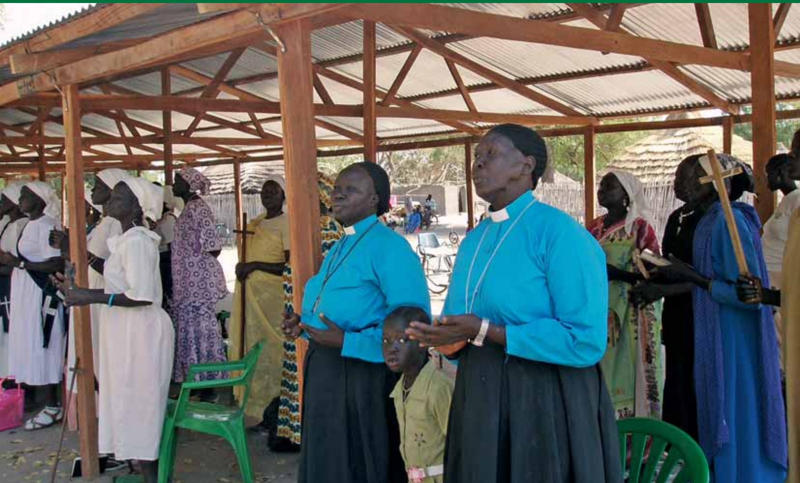
Et udvalg af Women's Union under det halvtag, hvor biskoppen og de gejstlige skal sidde.

Som fire engle gik de foran mig i procession, kvinderne fra Women's Union, som havde til opgave at betjene menigheden. Den gamle præst Elijah gik bagest. Klædt helt i hvidt og yndigt dansende, nærmest svævende til rytmen af den sang, deres stemmer frembar. Understøttet af trommerytmer og menighedens sang nærmede processionen sig det store baobabtræ, Rumbek katedral, som i yndig harmoni er vokset sammen med en slyngplante.