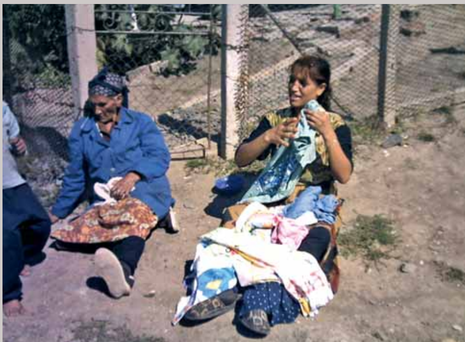
Ung mor modtager nyt tøj med glæde.