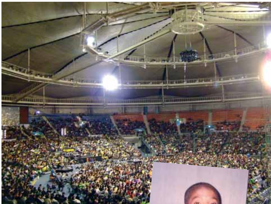
Proklamering af Bønnens år 2007, Seoul Olympic Stadium.

Der er brug for, at Nordkorea får religionsfrihed, at flygtninge fra Nordkorea anerkendes som flygtninge, når de kommer til nabolande som f.eks. Kina, for hvis de sendes tilbage, ender de i fangelejre, hvor mange dør af sygdom, sult, udmattelse