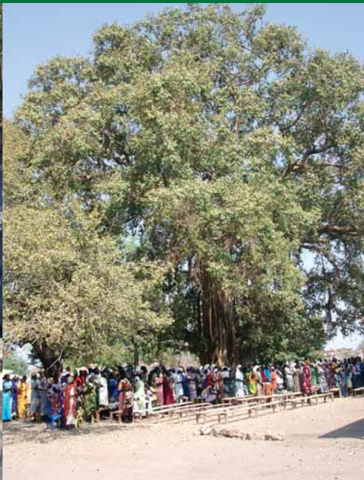
Det store baobabtræ, som udgør katedralen i Rumbek.

vil flyve, når udefra kommende kræfter påvirker det, for eksempel i form af et vindpust. Alle støvkorn flyver – en verden ramt af krig, død og ødelæggelse – når en håndfuld støv vendes på hovedet.