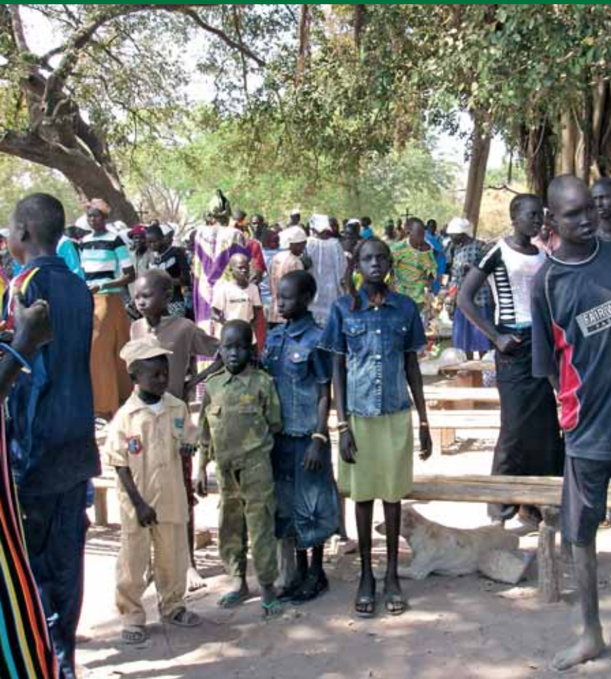
Et udsnit af menigheden.