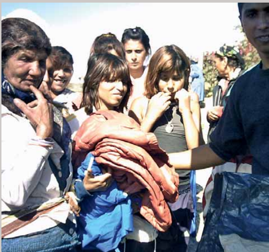
Uddeling af tøj fra Sarons Slette.