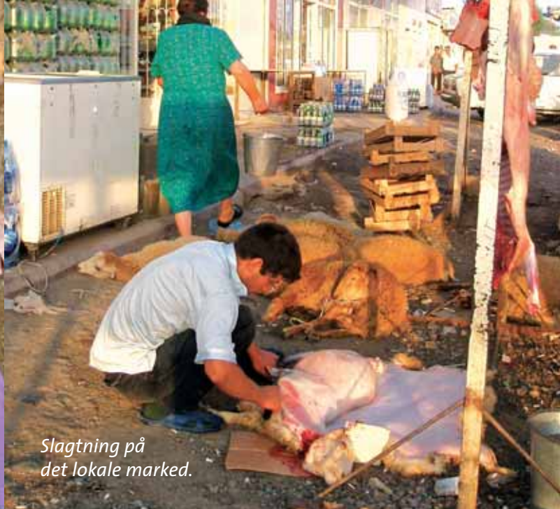
Slagtning på det lokale marked.