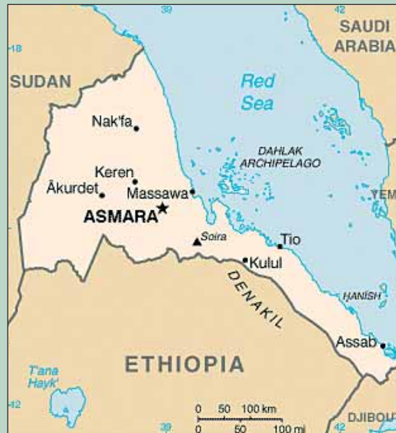
Kort over Eritrea.