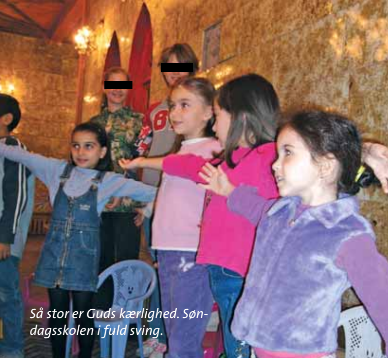
Så stor er Guds kærlighed. Søndagsskolen i fuld sving.