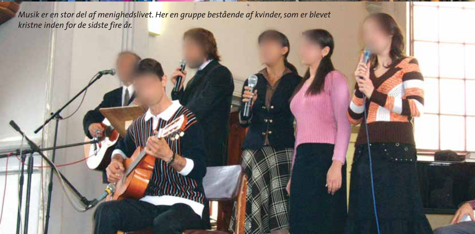
Musik er en stor del af menighedslivet. Her en gruppe bestående af kvinder, som er blevet kristne inden for de sidste fire år.

Dansk Europamission er også i kontakt med det aserbajdsjanske bibelselskab, en kristen boghandel i hovedstaden, folk, som driver en privatskole på kristent grundlag, osv.