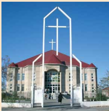
En af de kirker i Shymkent, som nu retsforfølges, chikaneres og trues af lukning.

Forværret situation i syd! I starten af oktober var jeg i det sydlige Kasakhstan i byen Shymkent. Shymkent og syden er meget anderledes end her. Islam er kommet ind med vældig kraft, og moskéer er skudt op som paddehatte inden for de sidste tre år! I Shymkent og i området omkring byen er der ca. 600 moskéer! Kirkerne i området er under forfølgelse, og næsten alle kirker er under anklage fra lokale myndigheder og er involveret i retssager, som kører imod dem! Visse lokale myndigheder siger åbent, at de vil lukke alle kirker i Shymkent, og ud af 23 kirker er de tre blevet lukket i år. Desuden er adskillige udlændinge blevet smidt ud af landet!