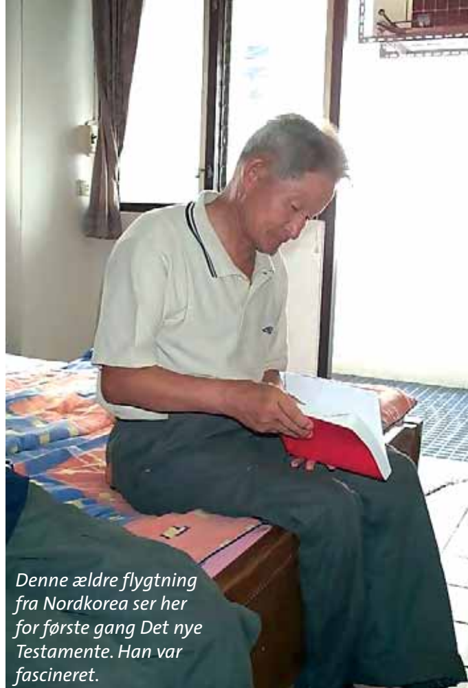
Denne ældre flygtning fra Nordkorea ser her for første gang Det nye Testamente. Han var fascineret.

Menneskerettighederne i Nordkorea overtrædelse som under Holocaust og bør ikke negligeres længere