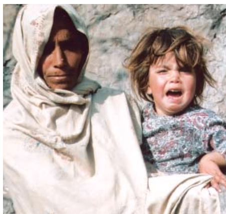
Det er smerteligt at tænke på, hvad de mange børn, der også er ofre for jordskælvet, nu må gå igennem.