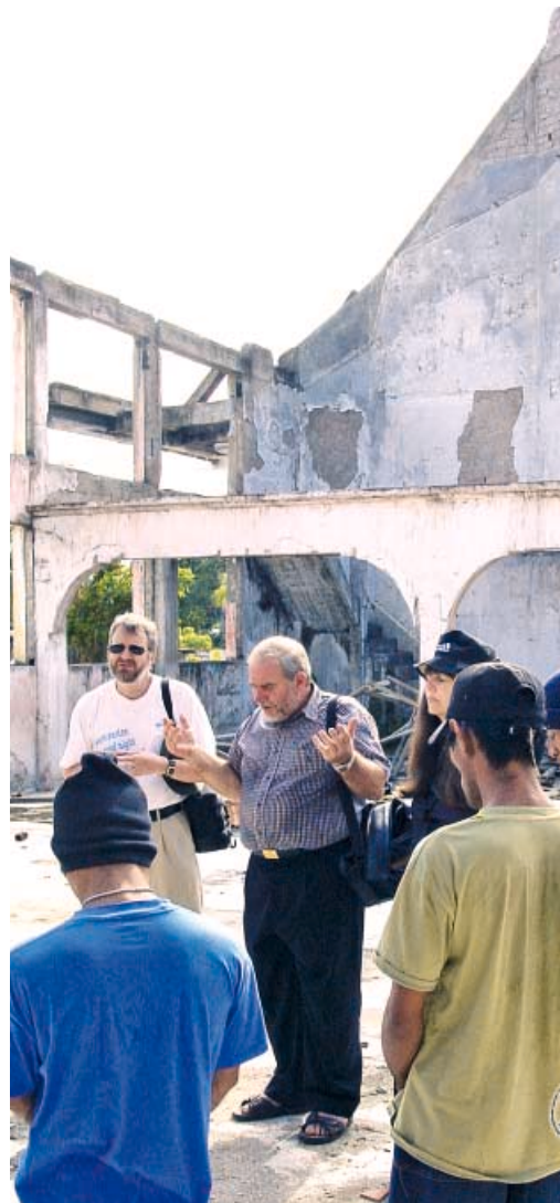
Kirke i Poso i Indonesien – nedbrændt af ekstremister.