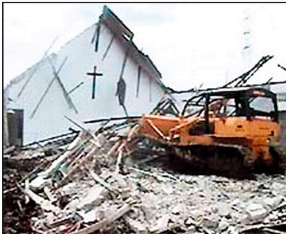
Til venstre ses tvangsnedrivning af kirke i Indonesien.

modtaget nogen nyheder om planen for nedrivningen af disse kirkebygninger.