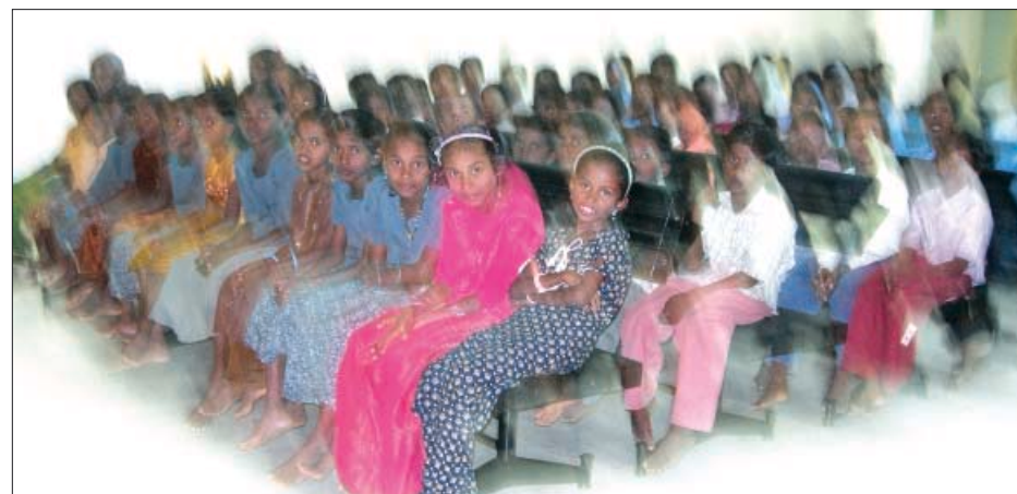
Nogle af Guds dejlige børn i Indien.

Dansk Europamission er allerede engageret i samarbejde med en sydindisk kirke - Bethany Fellowship - med formidling af sponsorer til børn på et af kirkens børnehjem, børn, som er blevet forældreløse i tsunamien sidste år. Vi er også i gang med forarbejdet til afvikling af en spedalskhedskoloni, hvor vi samler midler til mad, medicin og jobtræning, så de 300 spedalske kan blive helbredt og - sammen med deres familier - blive en del af samfundet igen og få deres liv tilbage.