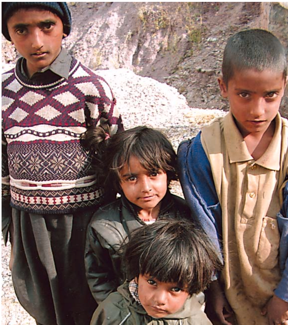
3800 overlevende efter jordskælvet i Pakistan har nu fået hjælp af Dansk Europamission.

I Dansk Europamission takker vi enhver, der har tænkt på ofre og sendt et bidrag. Det har betydet, at mennesker, der måske ville have sultet og være frosset ihjel, nu har en større chance for at overleve vinteren.