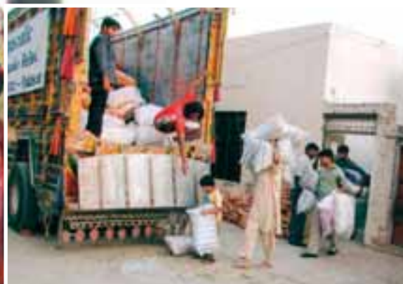
Vognen læsses: Alle hjælper til, når vognen skal læsses.