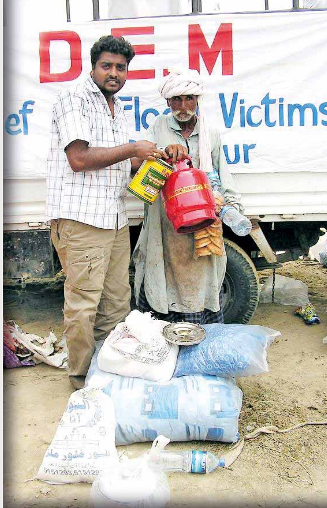
Et af de jordskælvsramte ofre i Baluchistan modtager hjælp.

Tabir uddeler en symaskine til en nyuddannet sy pige.