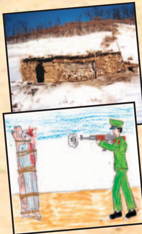
Et hjemmelavet skjulested i det nordøstlige Kina.

Bliver man som flygtning fanget i Kina og sendt tilbage til Nordkorea, risikerer man dødsstraf, specielt hvis man har været i kontakt med kristne.