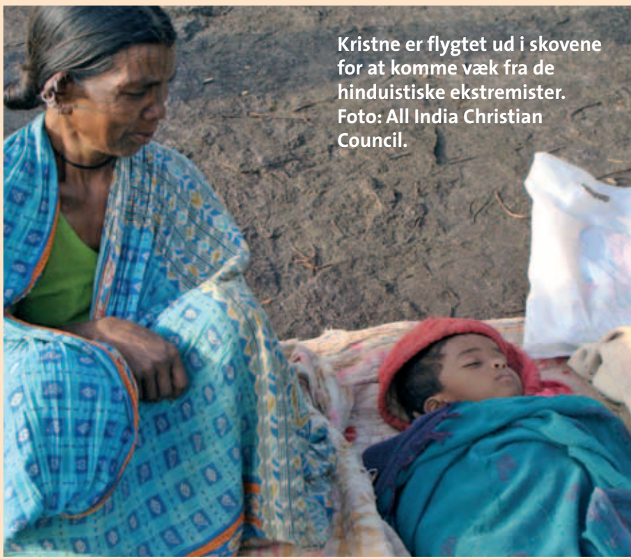
Kristne er flygtet ud i skovene for at komme væk fra de hinduistiske ekstremister.

hos os. Vi blev på politiforposten, indtil den vagthavende politiassistent i Balliguda kom med sit polititeam og tog os med til Balliguda. De var bange for at tage os direkte til politistationen, og de holdt os tilbage i en jeep i nogen tid. Fra en garage bragte de os til stationen. Vagthavende og nogle regeringsemdsmænd tog mig i enrum og spurgte mig, hvad i alverden der var sket mig. Jeg fortalte det hele detaljeret til politiet, om hvordan jeg var blevet overfaldet,